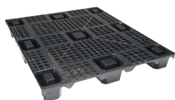
Ecopall 1000 s/marco